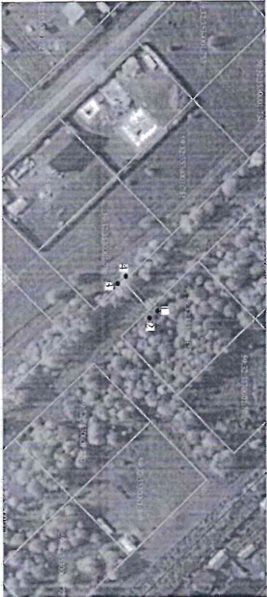
Схема расположения границы публичного сервитута Объект: Строительство ВЛ 0,4 кВ с Устьинькой ТУ для электрооборудования геребви Горская (4500070919) Местоположение: Пермский край, Пермский район, Сайбенское с/пос., ф. Горская Площадь земель или части земельного участка, кв. м: 69 Категория земель: Земли населенных пунктов Вид разрешенного использования: —